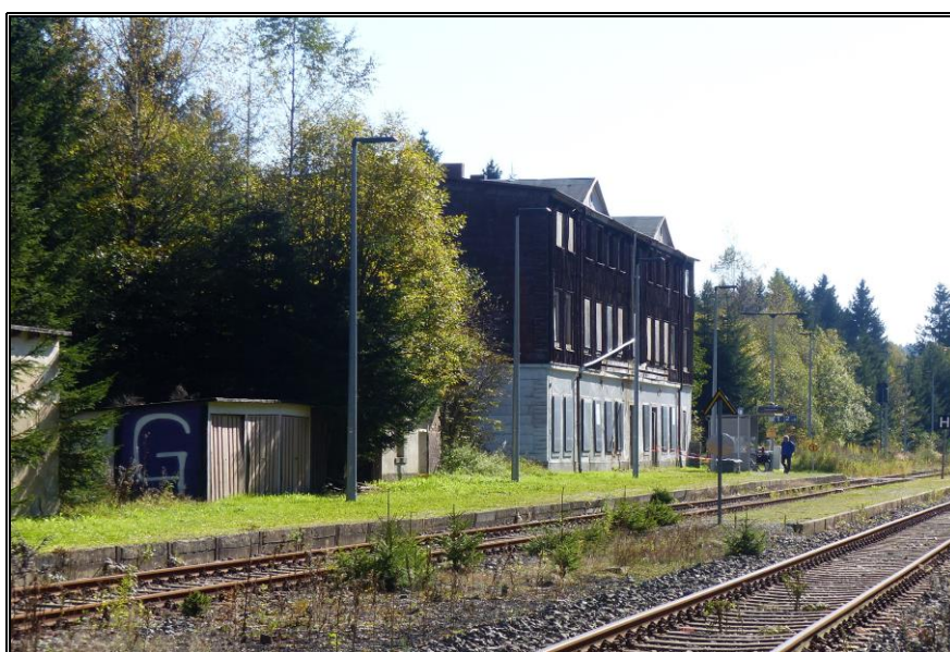
Současný stav budovy dopravní Zwotental (10. 10. 2021)

Provozovatelem nyní „hlavní“ trati z Falkensteinu do Klingenthalu státní hranice je společnost Deutsche Bahn Netz, A.G.; trať ze Zwotentalu do Adorfu (V.), která je t.č. bez pravidelného provozu, provozuje firma Regio Infra Service Sachsen (RIS).