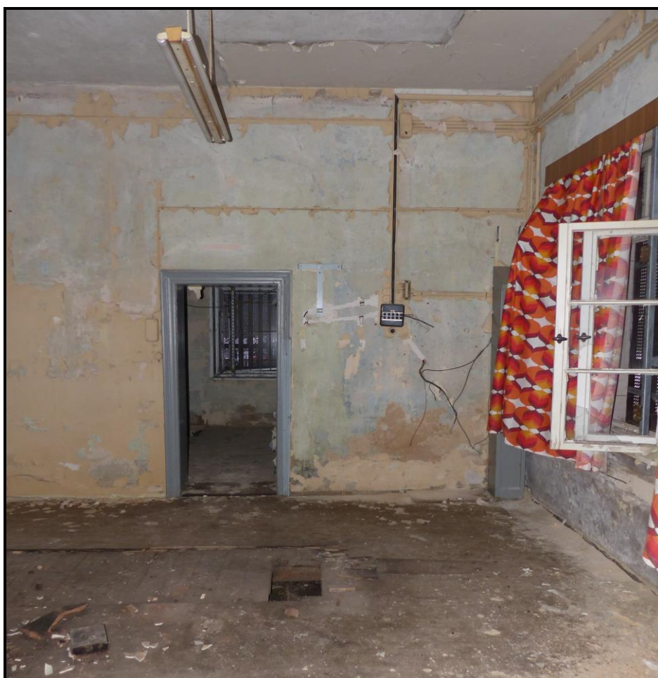
Jedna z místností uvažovaných pro expozici Muzea Kraslické dráhy (21. 2. 2022)

Provoz pobočky Muzea Kraslické dráhy zajistí OVEB; Železniční muzeum Kraslice bude zajišťovat doplňování a aktualizaci výstavy.